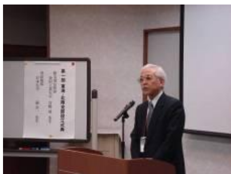
宮野新支部長挨拶